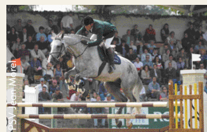
Jadis de Toscane