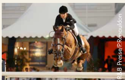
Itot du Château