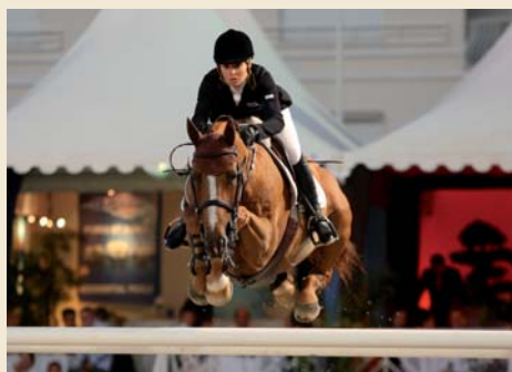
Itot du Chateau