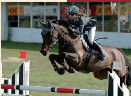
Made in Margot