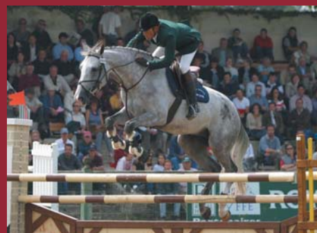
Jadis de Toscane